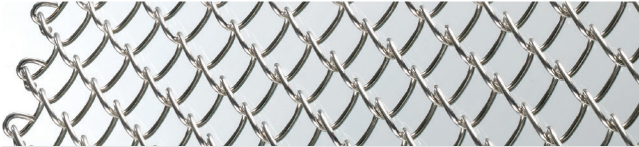
Gruppe 500 / 550