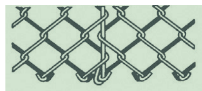
Gruppe 550 - runde Spiralforn