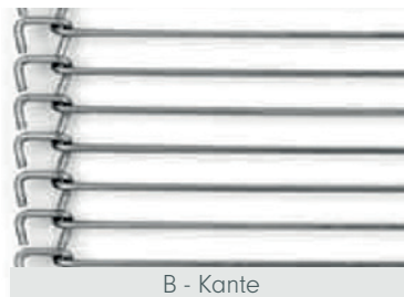
B - Kante