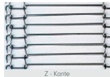
Z - Kante