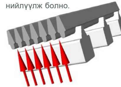
Функцийн патентлагдсан UH профиль

Хэрэглэгчийн тусгай шаардлагад нийцүүлж торыг төрөл бүрийн хэлбэр хэмжээтэйгээр үйлдвэрлэх боломжтой. Үүний хэлбэр нь нүхний хэмжээ, цар хүрээг тодорхойлж, бүтээгдэхүүн гаргах хэмжээнд нөлөөлдөг бөгөөд хамгийн бага торны нүхний хэмжээ нь 30 мкм байна. Тусгай хэрэглээнд зориулагдсан тусгай профиль болон тусгай гангийн зэрэглэлийг хэрэглэгчийн хүсэлтээр нийлүүлж болно.